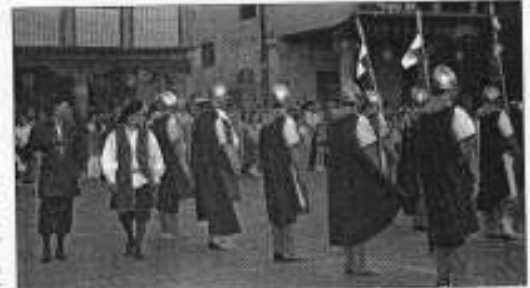
15. Las artes en Tordesillas