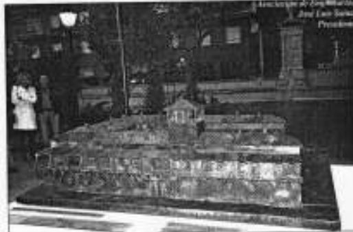
16. Semanas de Tordesillas